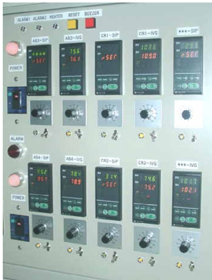
表示・操作パネル写真