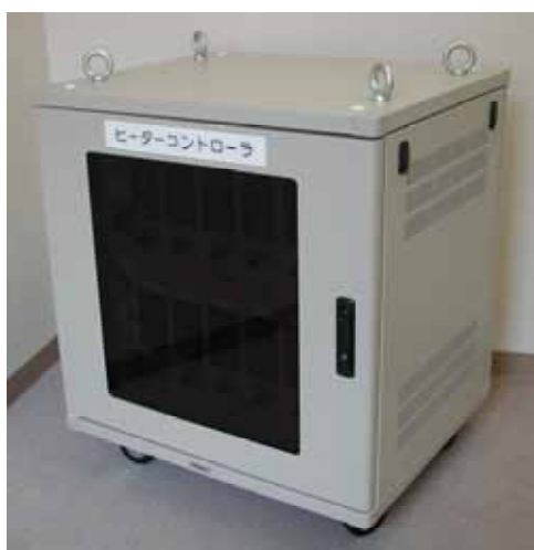
ユニット外観写真